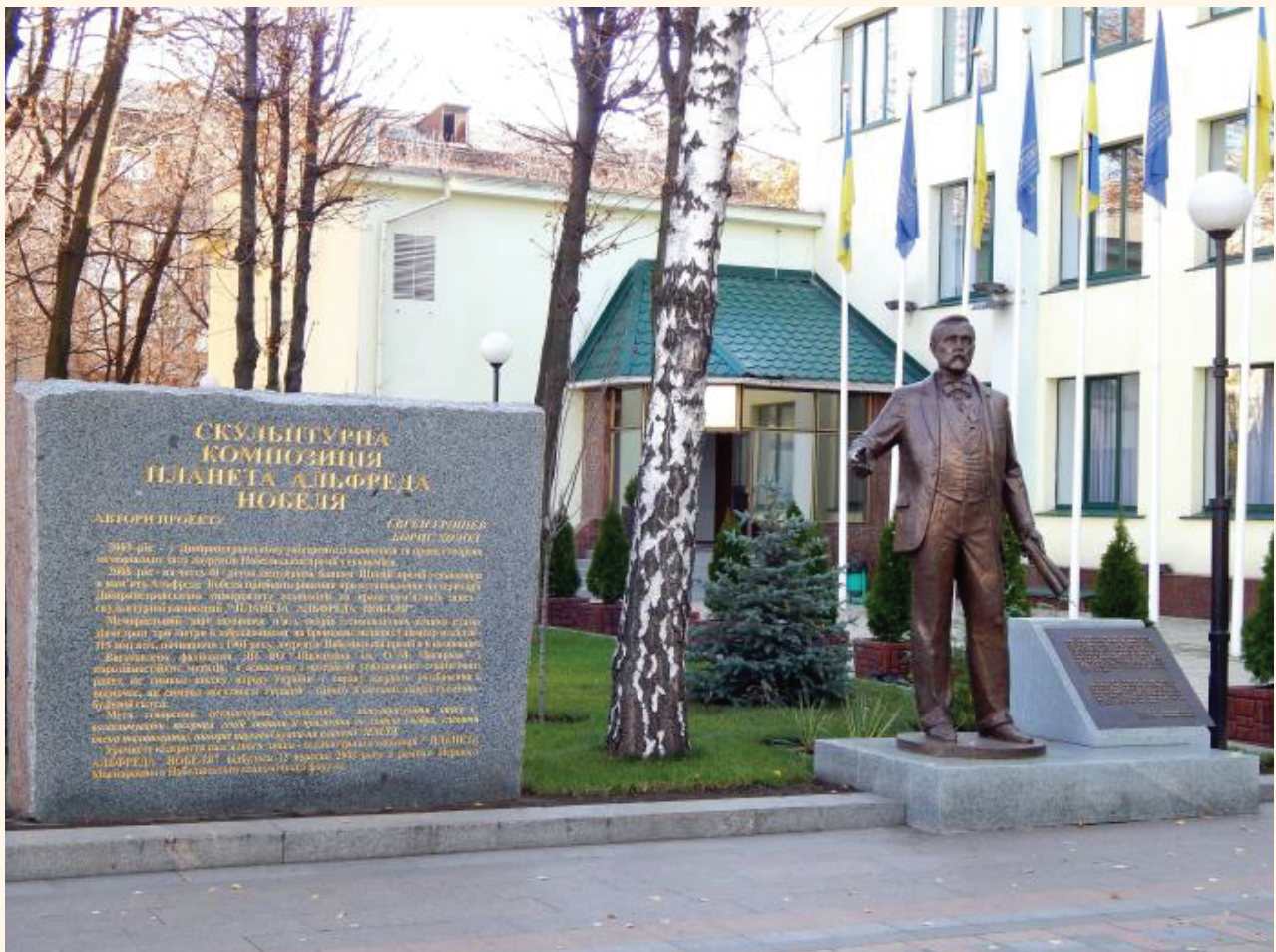
Пам'ятник А. Нобелю на території закладу вищої освіти «Університет ім. Альфреда Нобеля», Україна, м. Дніпро

Голова правління Нобелівського Фонду (1993-2005 рр.) Бенгт Самуельсон